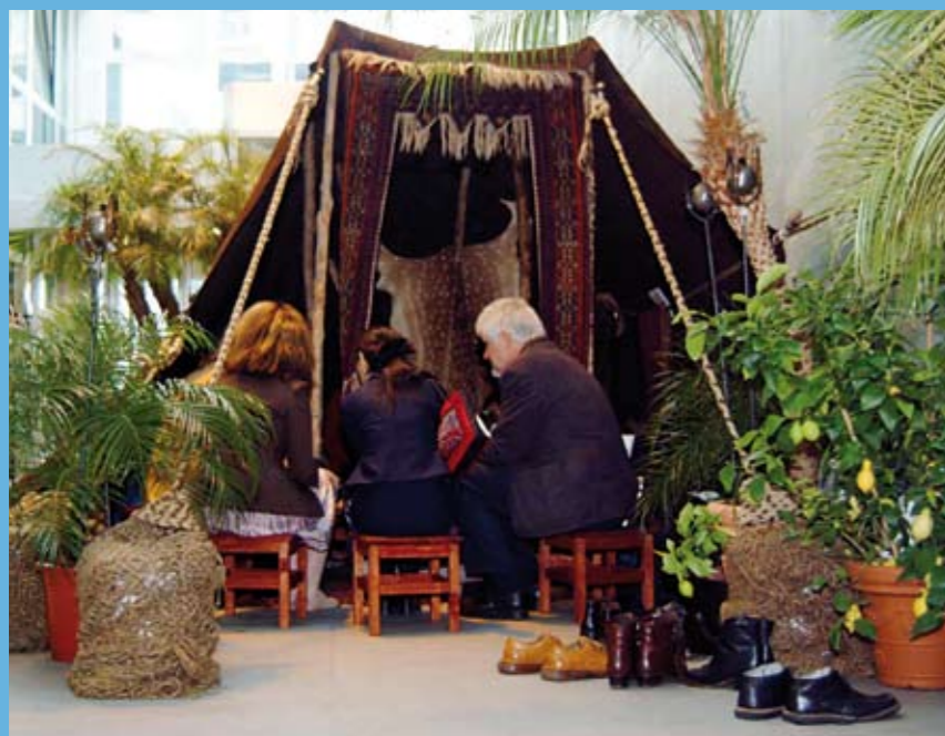
«Tente de storytelling» mise en place à l'occasion du colloque Dare to Share Fair (2004). Les visiteurs étaient invités à retirer leurs chaussures avant d'entrer en étrangers et de ressortir en amis.

Le fait de recourir au récit et de raconter une histoire («story telling») nous incite à communiquer les uns avec les autres. Des histoires simples peuvent éclairer des réalités complexes et révéler des vérités profondes; à cet égard, la force évocatrice du détail ne saurait être sous-estimée. Le fait de raconter une histoire – et d'être entendus et compris d'autres personnes – permet d'acquérir une certaine assurance. L'adjonction d'éléments narratifs dans des rapports plus traditionnels attire l'attention du lecteur tout en signalant clairement l'importance accordée à l'alternance des voix et perspectives.