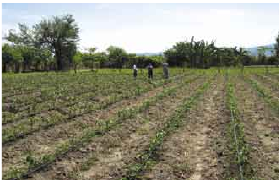
Sistema de riego por goteo en América Central

El Equipo GIRH es el punto focal para los asuntos técnicos. El es responsable de la coordinación con otras autoridades federales y de representar la posición de la COSUDE en la temática agua en discusiones multilaterales en el Comité Interdepartamental de Desarrollo Sostenible (ISDC, por sus siglas en inglés). El Equipo GIRH también está a cargo de la asistencia y asesoramiento técnico para los programas y los socios, para formar redes, y aprender de otras instituciones en torno al tema del agua y el desarrollo.